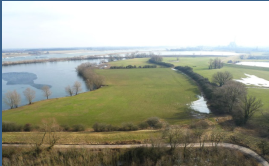
Luchtfoto Weurtsche Straatje